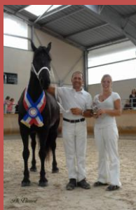
Coquine de la Pataz- championne de France 2013