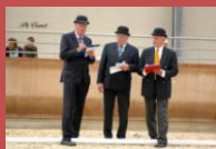
Nos 3 juges Hollandais