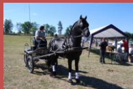
Kenzo du Bélier Etalon studbook