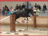
Ardan du Bélier, le nouvel étalon du studbook